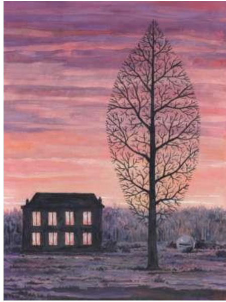
« La recherche de l'absolu », tableaux exécutés vers 1963, gouaches et encre, collections privées.